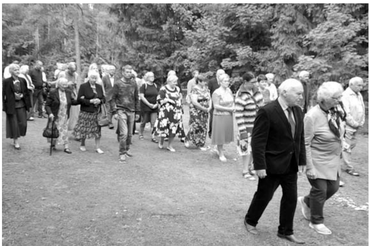
Į atlaidus Inkūnuose susirinko kelios dešimtys tikinčiųjų.