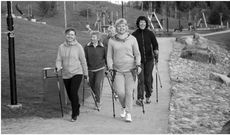
Judėjimas – ir džiaugsminga nuotaika, ir sveikata.

traukti ir atlikti tam tikrą darbą, reikalinga energija ir deguonis. Fizinis aktyvumas yra tada, kada, atliekant griaučių raumenų sukeltus judesius, energijos suvartojama daugiau nei ramybės būsenoje. Tai yra bet kokia žmogaus kūno judėjimo išraiška, sukelti didesnę medžiagų apykaitą: įvairios sporto rūšys, namų ūkio darbai ar laisvalaikio veikla, kuriai reikia fizinių pastangų“, – aiškino ji.