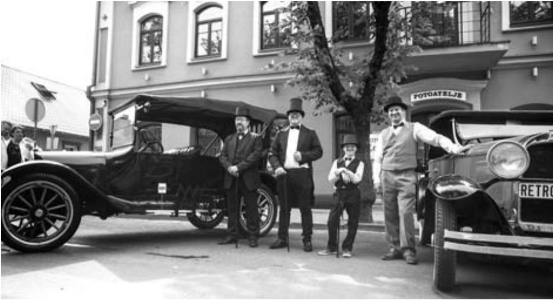
Tarpukariu pagaminti automobiliai yra važiuojantys, tačiau jų savininkai „Anykštai“ sakė, kad automobilių „nekankina“, važiuoja tik kelis kilometrus per miestą.