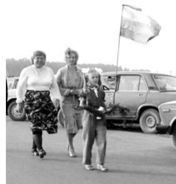
Knyga „Aldutė“ buvo parduodama per Anykščių miesto šventę.

narė, tarptautinės organizacijos „Krikščioniško gyvenimo bendruomenės“ narė.